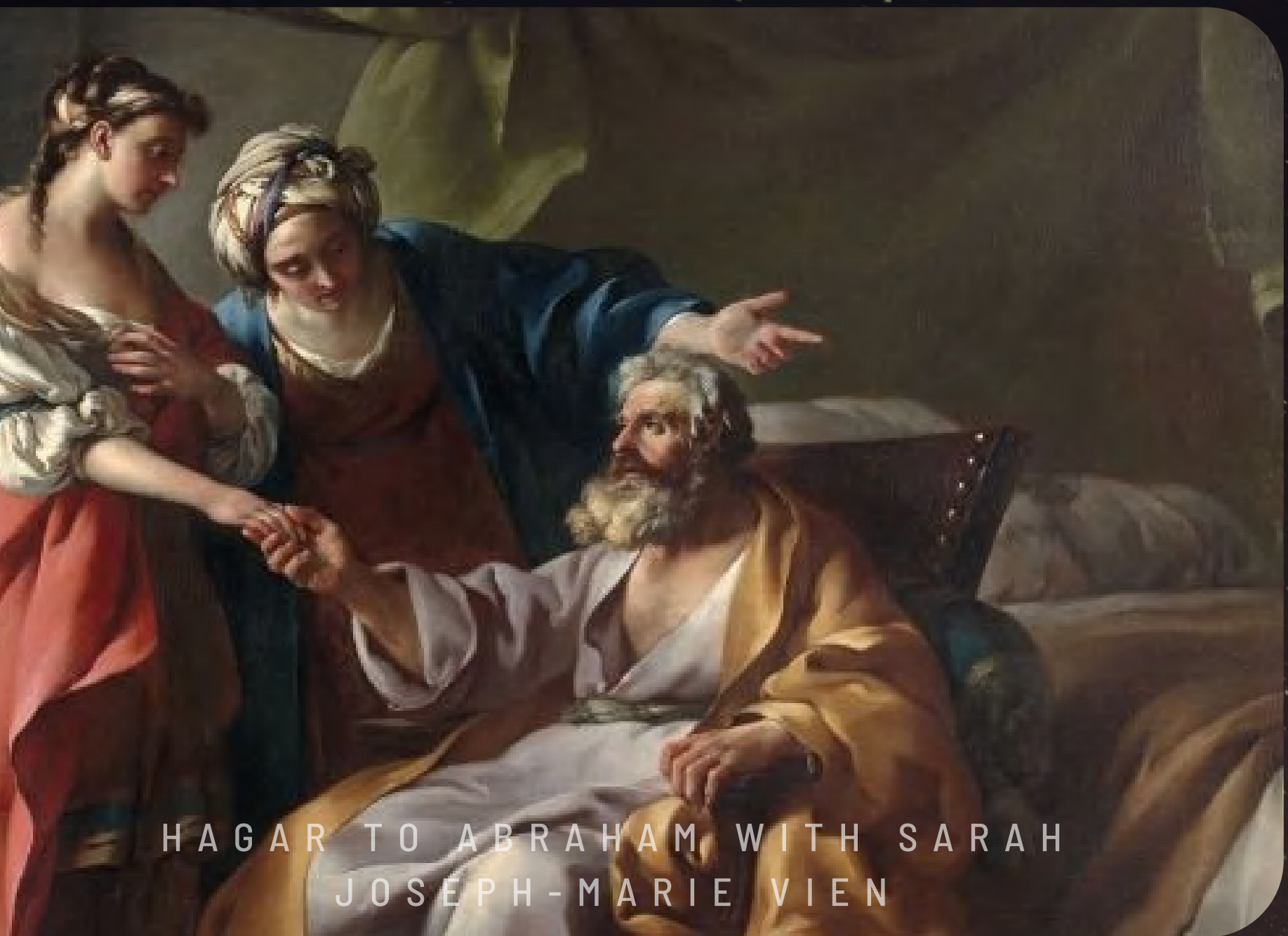
HAGAR TO ABRAHAM WITH SARAH JOSEPH-MARIE VIEN

"Abram und Sarai konnten keine Kinder bekommen, da Sarai unfruchtbar war. Eines Tages schlug sie ihrem Mann vor: »Du weißt, dass der Herr mir Kinder versagt hat. Aber nach den geltenden Gesetzen kannst du mir durch eine Sklavin Kinder schenken. Darum überlasse ich dir meine ägyptische Magd Hagar. Vielleicht werde ich durch sie doch noch Nachwuchs bekommen!«